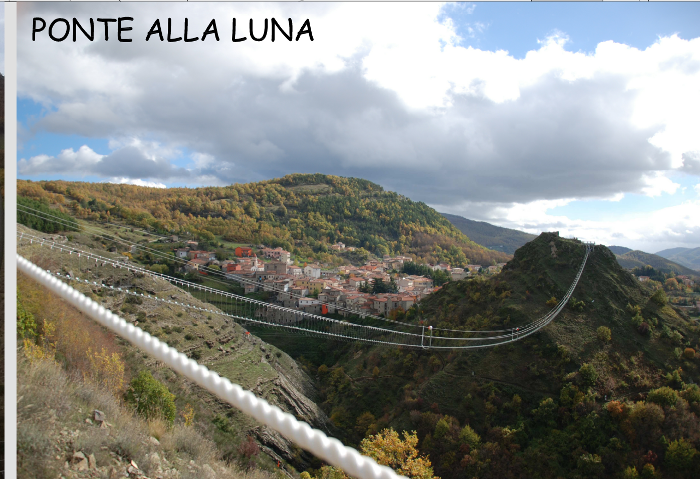
PONTE ALLA LUNA